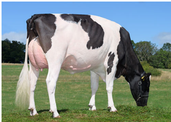
PTIT COEUR SIDEKICK DANCING DAUGHTER