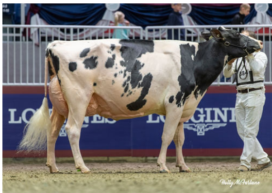
BIRKENTREE SIDEKICK ELLISSIA DAUGHTER

WILLSBRO ABBOTT WALNUTLAWN MCCUTCHEN SUMMER EX-94-2E-CAN 11* DE-SU BKM MCCUTCHEN 1174 MISTY SPRINGS LAVANGUARD SUE VG-89-4YR-CAN 13* COMESTAR LAVANGUARD MISTY SPRINGS FBI SUZANNE VG-87-2YR-CAN 4*